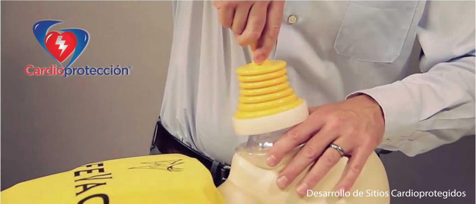
Desarrollo de Sitios Cardioprotégidos

El dispositivo LifeVac® puede producir hasta 300 mm/Hg de succión.