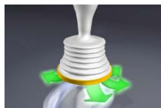
Su diseño impide empujar el objeto hacia adentro

El dispositivo cuenta con dos mascarillas (adulto y pediátrico), manual de uso y folleto con tips de seguridad.